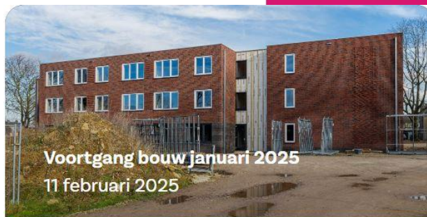
Voortgang bouw januari 2025 11 februari 2025

Wil je meebouwen aan SAM&ZO? Meld je aan voor een speeddate!