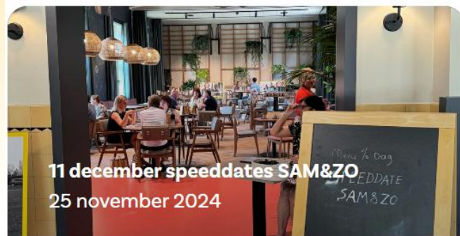
11 december speeddates SAM&ZO 25 november 2024

Wil je meebouwen aan SAM&ZO? Meld je aan voor een speeddate!