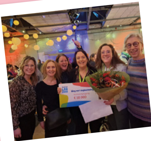
Een van de twee prijswinnaars Amarant

In januari 2024 vond het Festival Lab 2030 Online plaats over 'Weg met traditionele dagbesteding'. De bijeenkomst was de afsluiting van het Lab 2030 Online waarin twintig teams aan de slag zijn gegaan met het vernieuwen van dagbesteding. Zij deelden hun bevindingen en het programma bood inspiratie voor anderen om ook aan de slag te gaan met vernieuwing.