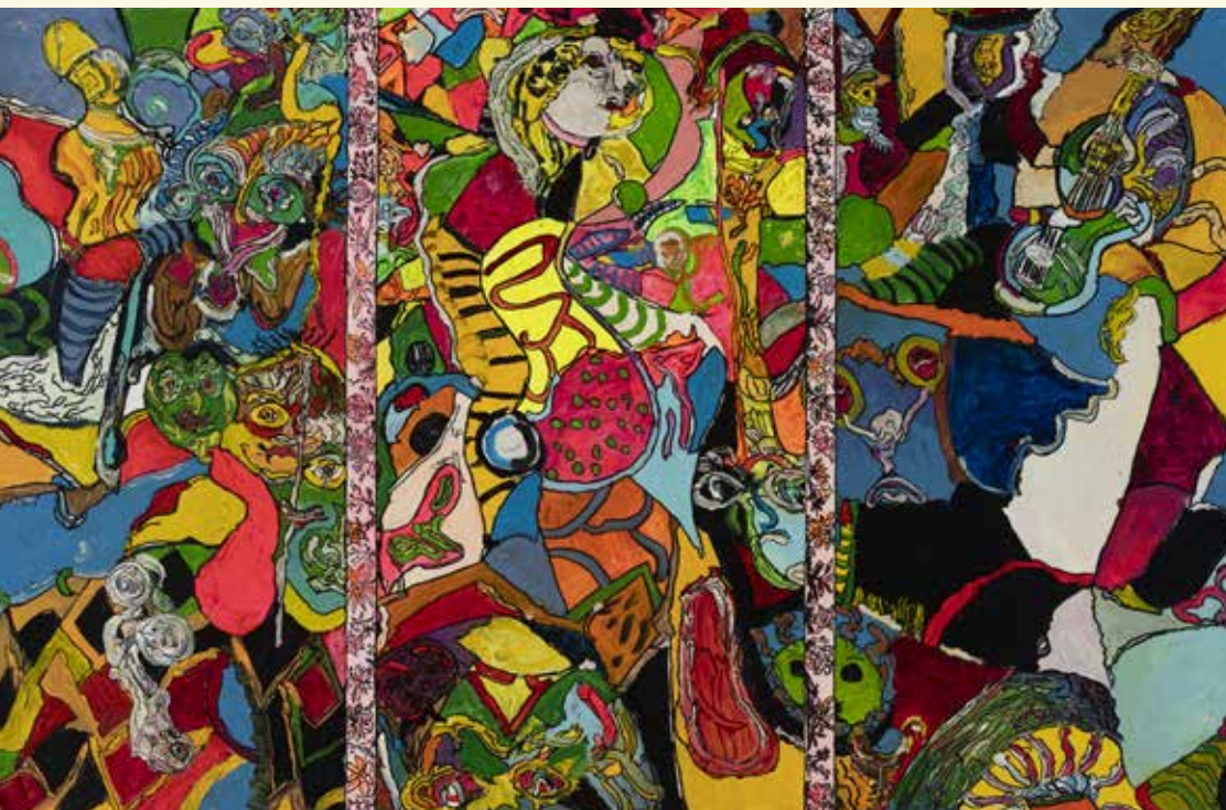
Werk van Frits Schreurs