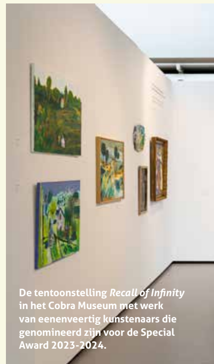
De tentoonstelling Recall of Infinity in het Cobra Museum met werk van eenenveertig kunstenaars die genomineerd zijn voor de Special Award 2023-2024.

tot 2023 bestuurder bij Avelijn. Hij was vanaf 2013 enthousiast ambassadeur van de Art Brut Biënnale, een tentoonstelling van beeldende kunst. 'In onze ateliers werd prachtige kunst gemaakt. Dat wilden we zichtbaar maken.' De Art Brut Biënnale heeft zich ontwikkeld tot een erkend 'beeldbepalend evenement' in Overijssel, met tienduizend bezoekers en werk van nationale en internationale kunstenaars. 'Het is een enorme impuls voor de mensen op ateliers om die waardering te krijgen. Ze doen volwaardig mee.'